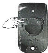
Druk kort op de gewenste bedieningstoets